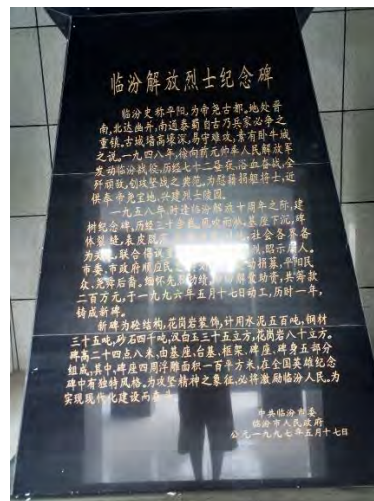
通过碑文学习历史