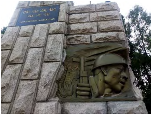
烈士陵园门口（左侧）