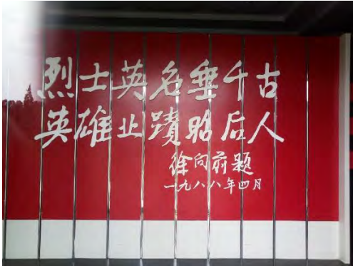
临汾英烈纪念馆（内）