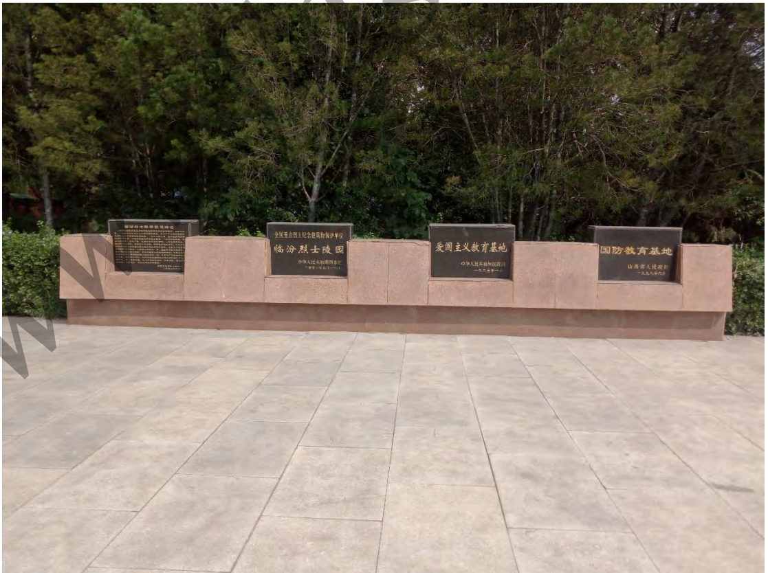
爱国主义教育基地