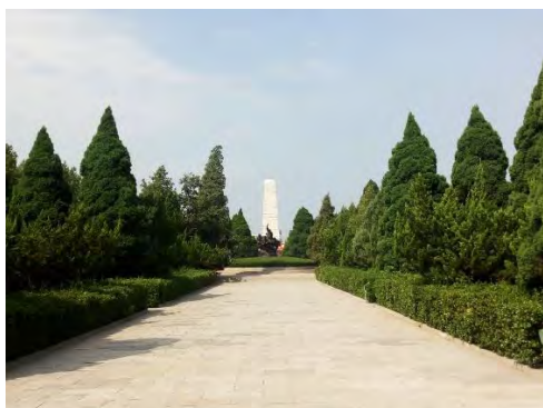
远眺雕像和革命烈士纪念碑

的基本信息，通过学习碑文，我增长了很多知识，对临汾这座城市有了更加深入的了解。我在碑前默哀三分钟，以表达我心中的哀思之情和崇敬之意。