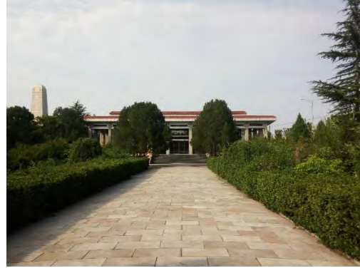
临汾英烈纪念馆（远）

实践中遇到了一同来陵园的游客，我与他们进行了短暂的交流，传扬先烈们的革命精神。通过交流，我了解到临汾解放战役，在徐向前司令员指挥下，我军共有 6 万人参战，历经 72 昼夜，歼敌 2.5 万余人，俘获晋军中将副司令梁培璜等高级将领，取得解放晋南的最后的胜利。我军亦有 7200 余名官兵壮烈牺牲，“光荣的临汾旅”即在此诞生。知道了王墉、杨英俊、东下庄等七烈士及临汾旅长黄定基等人的英雄事迹及实物。通过这次交流，我学到的不仅是历史，更是一种精神，一种生生不息的精神。