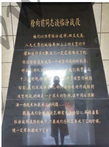
通过碑文传承精神

通过本次红色之旅，我获益匪浅。以党的十九大和庆祝建军 90 周年、建团 95 周年等重要纪念日为契机，我来到了烈士陵园，通过实地参观，追寻红色足迹，追忆革命历史，采撷革命故事，我在这里缅怀先烈、铭记历史、锤炼信仰，树立起了强烈的爱国热情和使命担当，在今后的生活学习中严格要求自己，励志用扎实的奋斗绘就无悔青春。本次红色之旅是对我精神的一次全新洗礼，在增强自己社会实践能力的同时，学习并弘扬了民族精神。