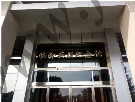
临汾英烈纪念馆（外）

之后，在幽林深处，我看到了临汾英雄纪念馆和临汾解放纪念馆。临汾英雄纪念馆的匾额“革命英雄纪念馆”为中顾委副主任薄一波于 1988 年 4 月题写，布展内容包括本区党史人物张振山、徐亚桑、王权五、景仙洲、张静波、李从文、陈自然、王金林等和革命烈士王墉、杨英俊、田云芳、李福俏、李福秀、东下庄七烈士及临汾旅长黄定基等人的英雄事迹及实物。临汾解放纪念馆的匾额“临汾攻坚”为徐向前元帅 1983 年 6 月题写，布展内容包括临汾历史、攻坚战全景、实物、图片等 200 余件。这次战役，在徐向前司令员指挥下，我军共有 6 万人参战，历经 72 昼夜，歼敌 2.5 万余人，俘获晋军中将副司令梁培璜等高级将领，取得解放晋南的最后的胜利。我军亦有 7200 余名官兵壮烈牺牲，“光荣的临汾旅”即在此诞生。遗憾的是，这两个纪念馆现在并没有开放，我只能拍照后惜别。